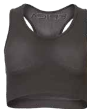
ART. 12TOP D