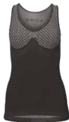
ART. 16CAN D